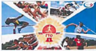
ГТО - путь к здоровью